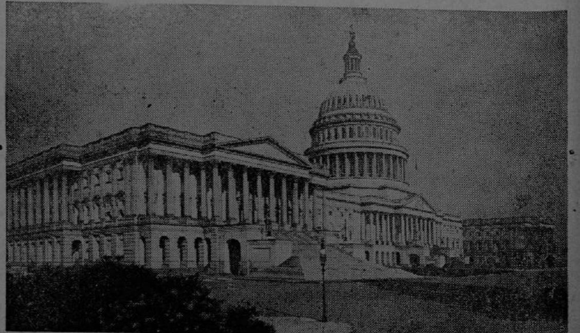
FOTOGRAFIA DEL CAPITOLIO DE LOS ESTADOS UNIDOS DE NORTE AMERICA, EN WASHINGTON D. C.

Teléfono 5304 — Apartado 219 SAN JOSE, COSTA RICA