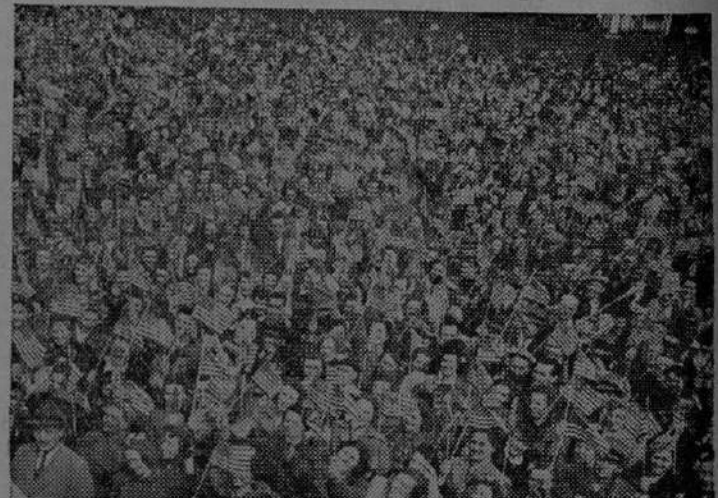
Obreros de Filadelfia en una ceremonia del Día de la Bandera.

WASHINGTON.—En el texto de su proclama para la celebración del Día de la Bandera el catorce de junio, el Presidente Truman manifestó que los ciudadanos deben consagrarse una vez más al espíritu del pabellón nacional, al cumplirse el primer año después de las más importantes victorias alcanzadas por los Estados Unidos y sus aliados en los campos de batalla durante la Segunda Guerra Mundial.